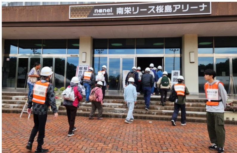
端末を持って避難する避難者