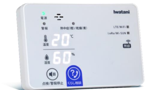
リアルタイムで避難状況が確認できる otta のシステム(左)と自宅に設置したイワタニゲートウェイ(右)